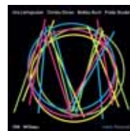
OM Willisau ★★★★☆