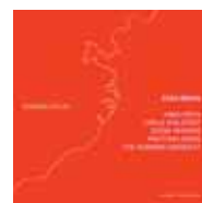
Cosa Brava Ragged Atlas