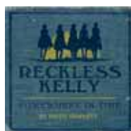
Reckless Kelly Somewhere In Time