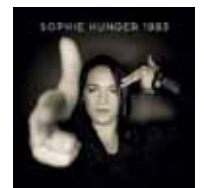
Sophie Hunger 1983

Vom sanft Souligen über Treibendes geht es bis zu leisem Gesang zu Klavier. Die im Vergleich zu früher entschlackte Instrumentierung fällt auf, wirkt aber nie karg. Grosse Erwartungen sind mit «1983» verbunden, die Hunger gut erfüllt. Urs Hangartner