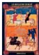
Jordi Savall Le Royaume oublié ★★★★☆