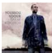
Youssou Ndour Dakar-Kingston