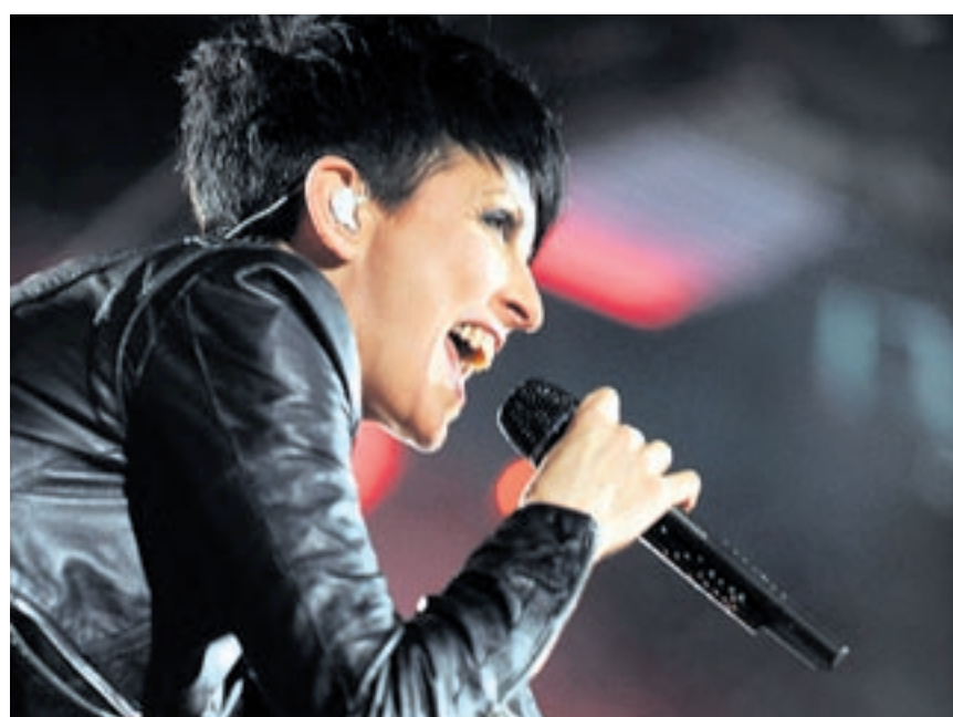
Nena macht auch das Alte neu und wirkt in Zürich so frisch wie am ersten Tag.

Seit acht Jahren ist sie wieder voll im Geschäft und zeigt sich von einer verblüffend frischen Seite. Neue Alben mit überraschenden Versionen der frühen Hits, neuer Sound mit überraschend langen, eingängigen Songs. Das neueste Album «Made in Germany» wirkt dagegen erstmals wieder wie der heute gängige, verspielte deutsche Pop. Entsprechend gespannt war man am Sonntagabend, wie sie die unterschiedlichen Stile unter einen Hut bringen würde. Sie tat es in gewohnt über-