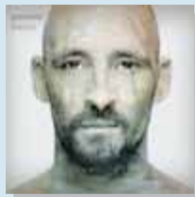
Gentleman – Diversity

Geeignet für Fans von: Calexico, The Band, Tom Waits