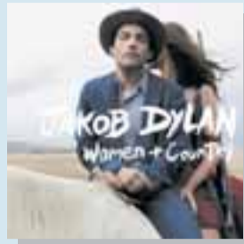
Jacob Dylan – Woman + Country

> Americana Mit den Wallflowers (mit denen er gerade durch die USA tourte) verdiente er richtig Geld, mit dem Top-Produzenten T Bone Burnett (s.a. Interview) veröffentlicht Jacob Dylan sein bisher bestes Album. Neben einigen Westcoast-Nummern im Country-Gewand befinden sich auf „Women + Country“ vier absolute Spitzentitel, wobei vor allem „Lend A Hand“ stark an Vater Bob erinnert. Aber auch der „Zirkus-Sound“ dürfte von elterlicher Prägung sein; die leicht angerauchte Stimme sowieso. 45 kurzweilige Minuten rasen also dahin, die Gastsängerinnen Neko Case und Kelly Hogan perfektionieren den Sound ebenso wie die exzellente Begleitband. Kritikpunkte? Eigentlich keine. Ein wirklich gelungenes Album. Vater Bob kann stolz sein. ✓✓✓